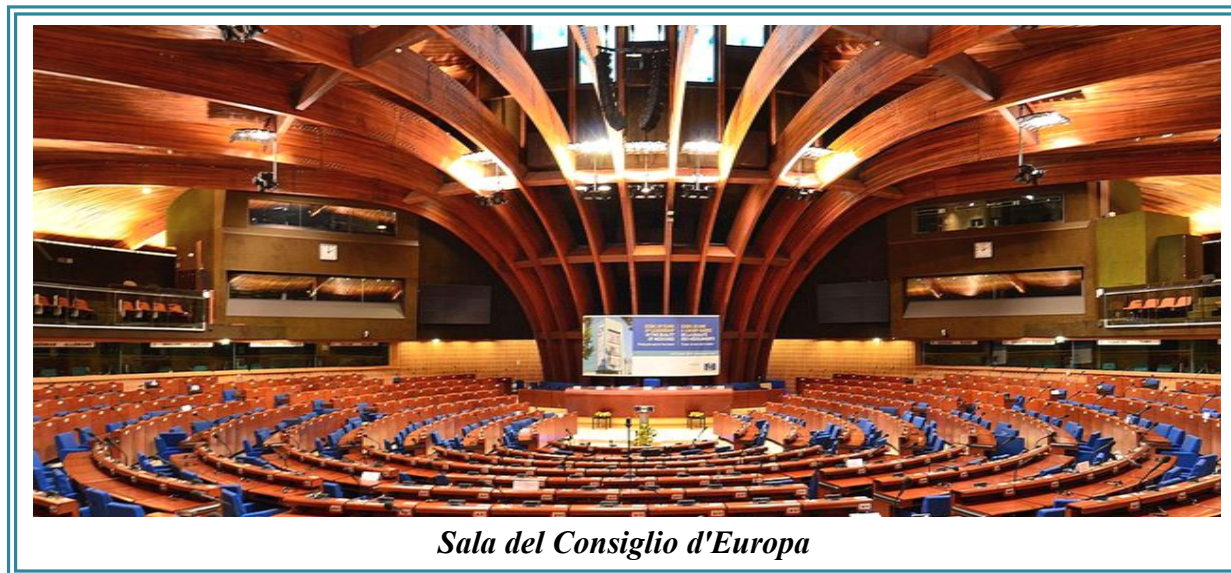
Sala del Consiglio d'Europa

“Il Comitato Europeo per la Prevenzione della Tortura e delle pene o trattamenti inumani o degradanti: rilievi e prospettive del Garante europeo delle persone detenute”