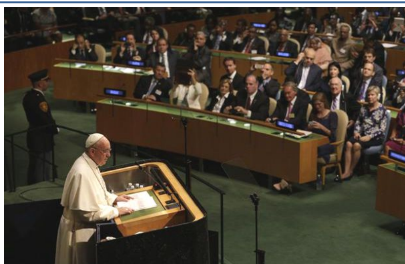
Papa Francesco all'ONU

➤ Il Vangelo non conosce l'uomo in generale. Incontra ogni persona in modo singolare. I suoi diritti non si possono ridurre a delle regole applicabili nello stesso modo dappertutto e per tutti. Se costituiscono un quadro di valori e di garanzie che si devono sempre difendere, sono da interpretare e talvolta da superare in nome del Vangelo ; purché siano realmente considerate la situazione e le atte-