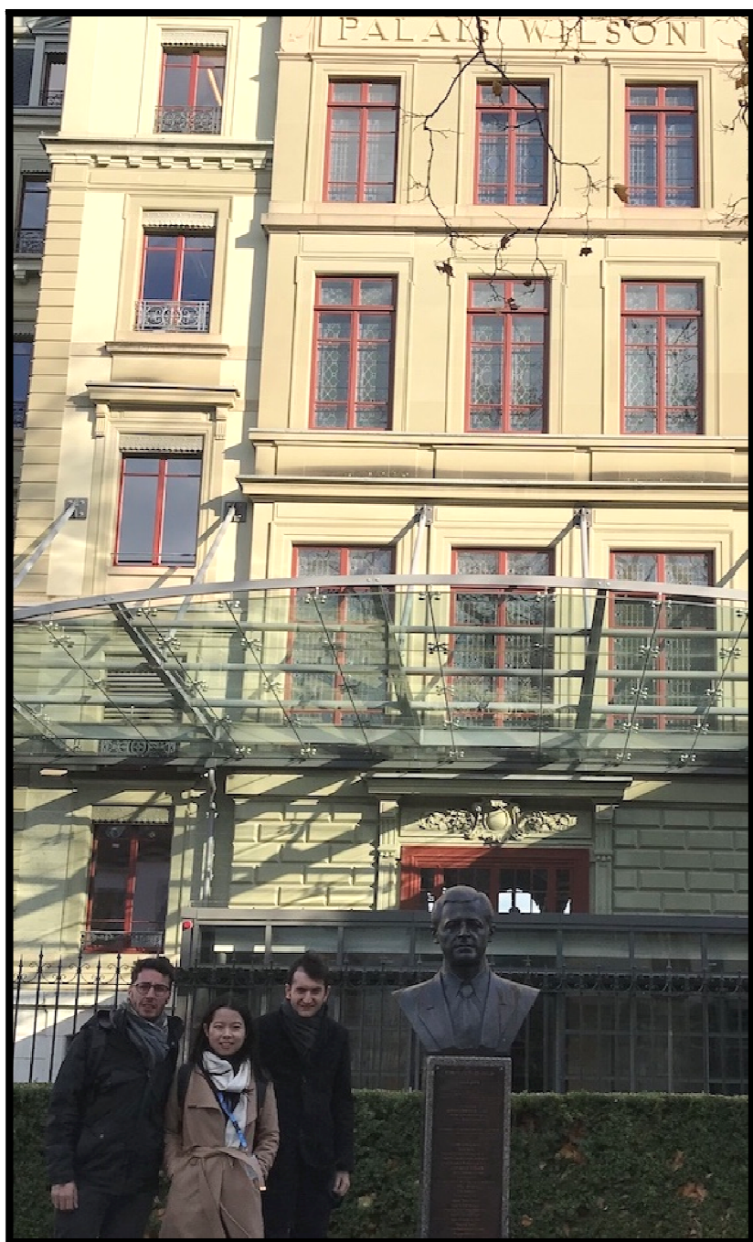
La Delegazione ACAT e FIACAT dinanzi al Palazzo Wilson, sede dell'Alto Commissariato per i diritti umani dell'ONU