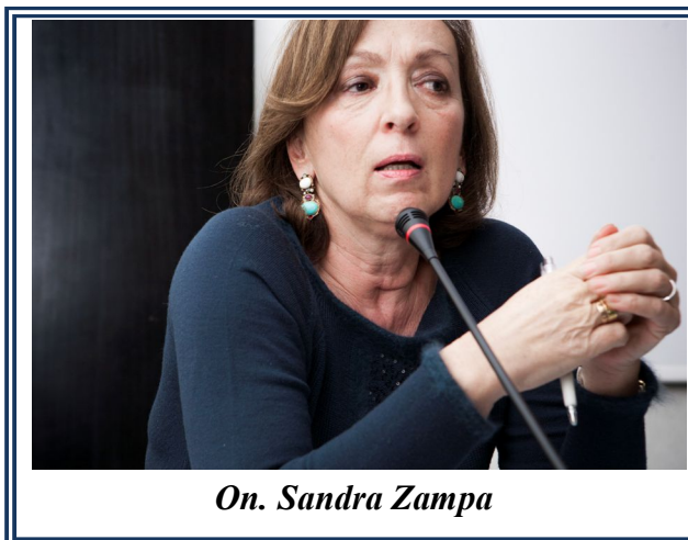
On. Sandra Zampa

“Quando ho cominciato a occuparmi di questo tema sono partita da Lampedusa ed era il 2011” inizia da qui, infine, Sandra Zampa , per raccontare il percorso della legge che porta il suo nome. La sua esposizione ha mostrato, oltre alla riconosciuta competenza, anche una grande partecipazione emotiva al tema trattato. Base imprescindibile per la formu-